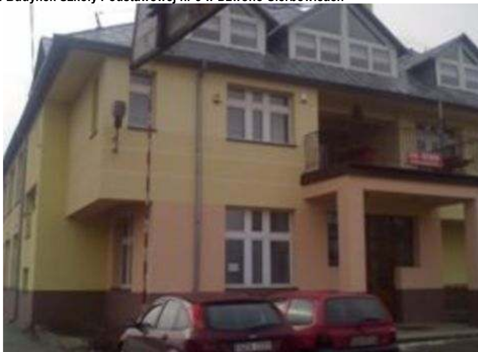
Rysunek 4 Budynek Szkoły Podstawowej nr 3 w Dzwono-Sierbowicach