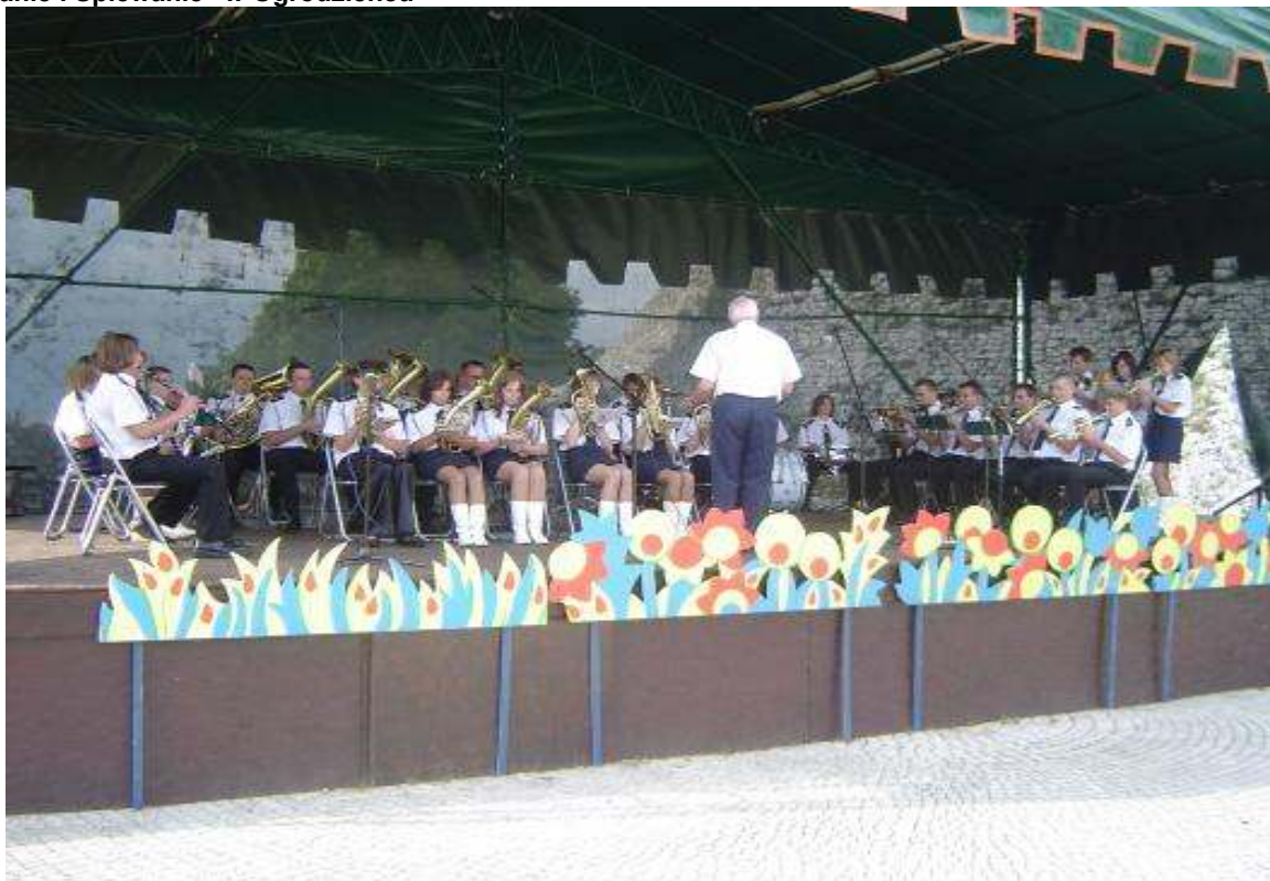
Rysunek 5 Występ Młodzieżowej Orkiestry Dętej OSP Dzwono-Sierbowice podczas imprezy „Jurajskie Granie i Śpiewanie” w Ogrodzieńcu