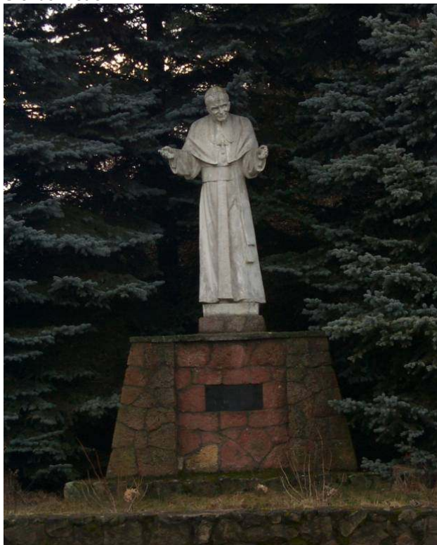
Rysunek 2 Pomnik papieża Jana Pawła II oraz kapliczka, elementy zespołu kościelnego w Dzwono-Sierbowicach