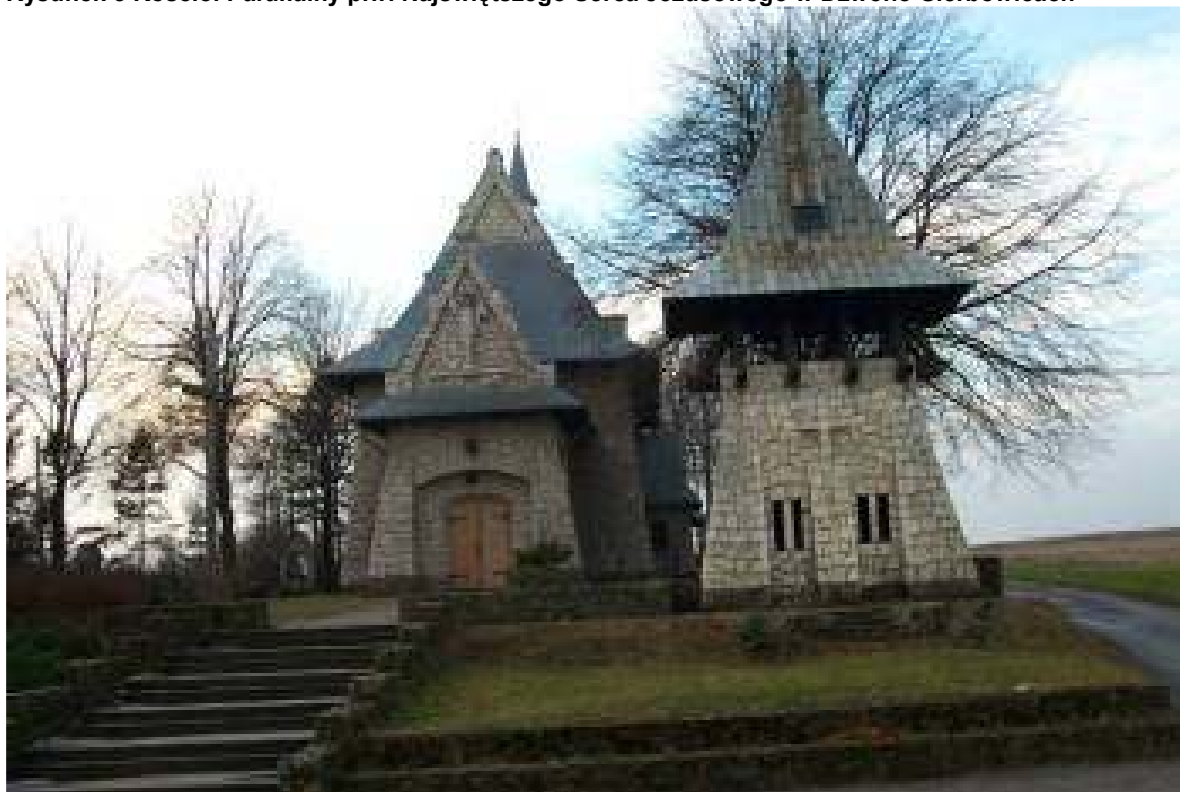
Rysunek 3 Kościół Parafialny p.w. Najświętszego Serca Jezusowego w Dzwono-Sierbowicach