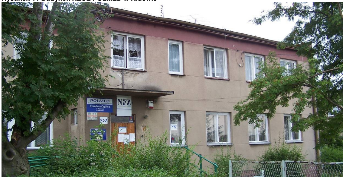
Rysunek 11 Budynek NZOZ POLMED w Kidowie