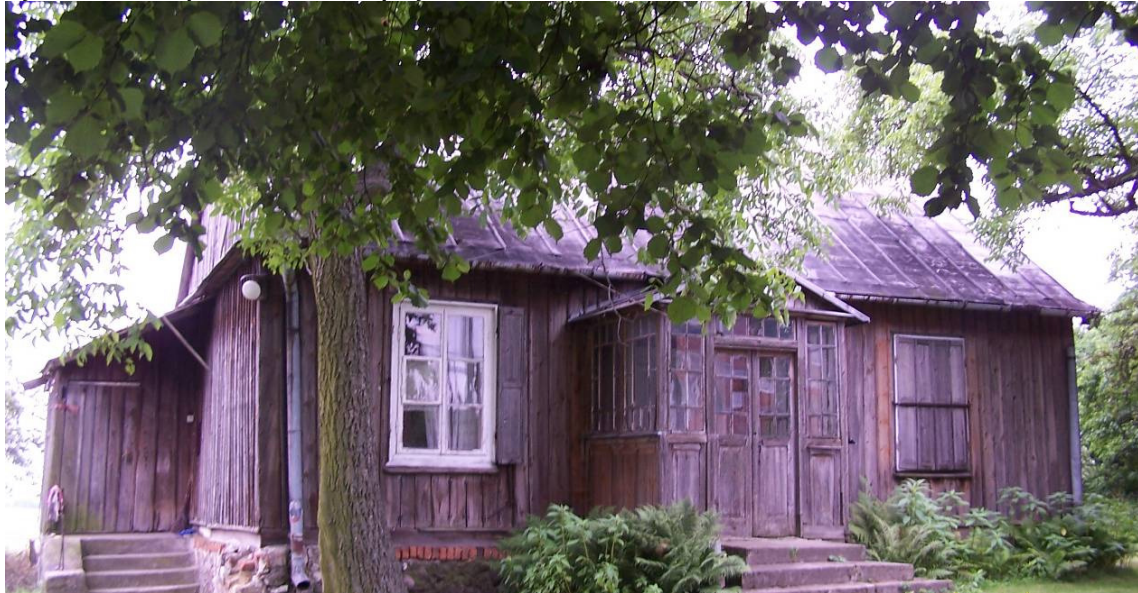
Rysunek 7 Chałupa z końca XIX w. przy kościele