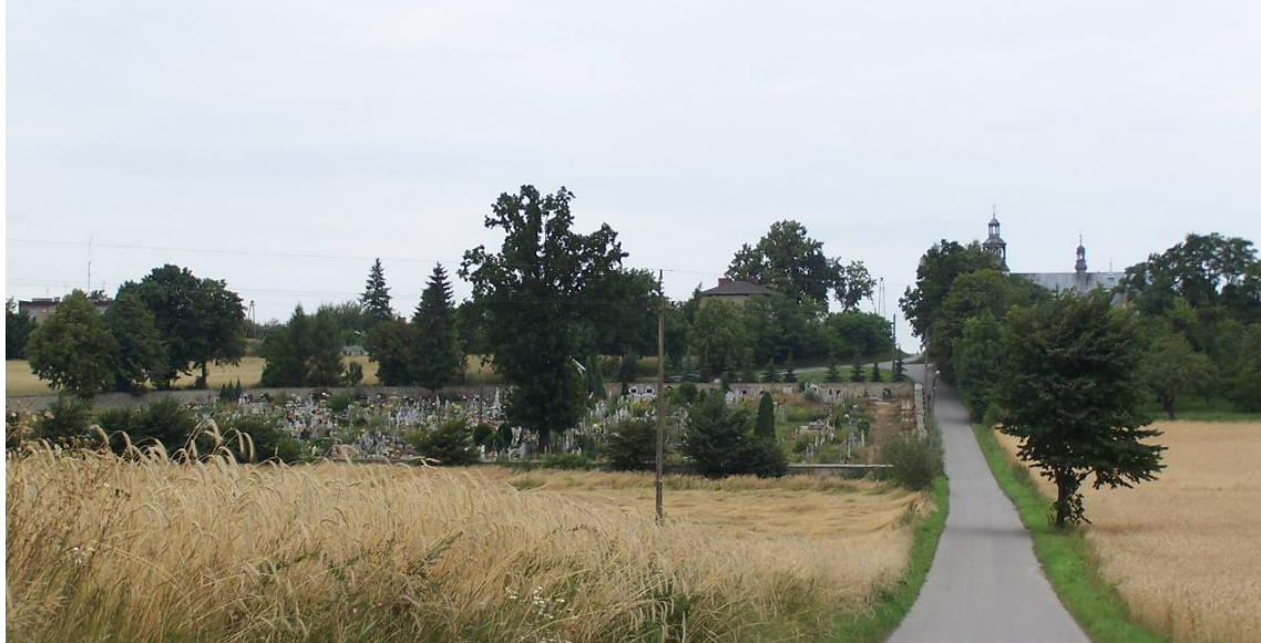
Rysunek 3 Widok na cmentarz parafialny i kościół (w oddali po prawej stronie)