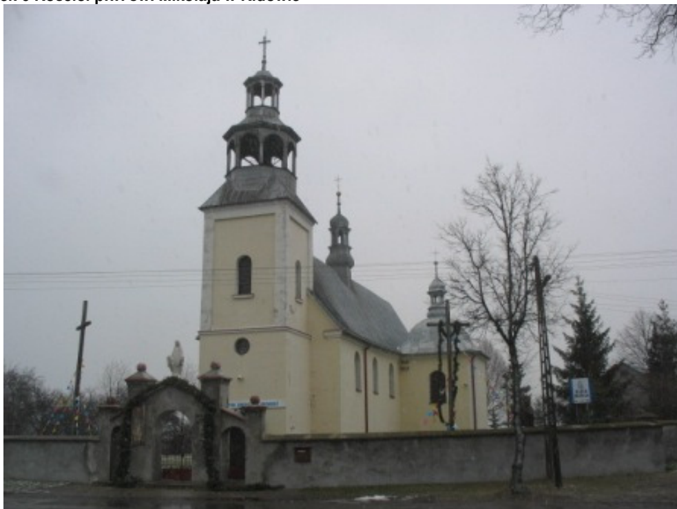
Rysunek 6 Kościół p.w. św. Mikołaja w Kidowie