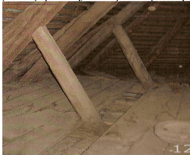
Rysunek 14 Detale połączenia więźby dachowej, widoczne przemoknięcia i ślady zużycia