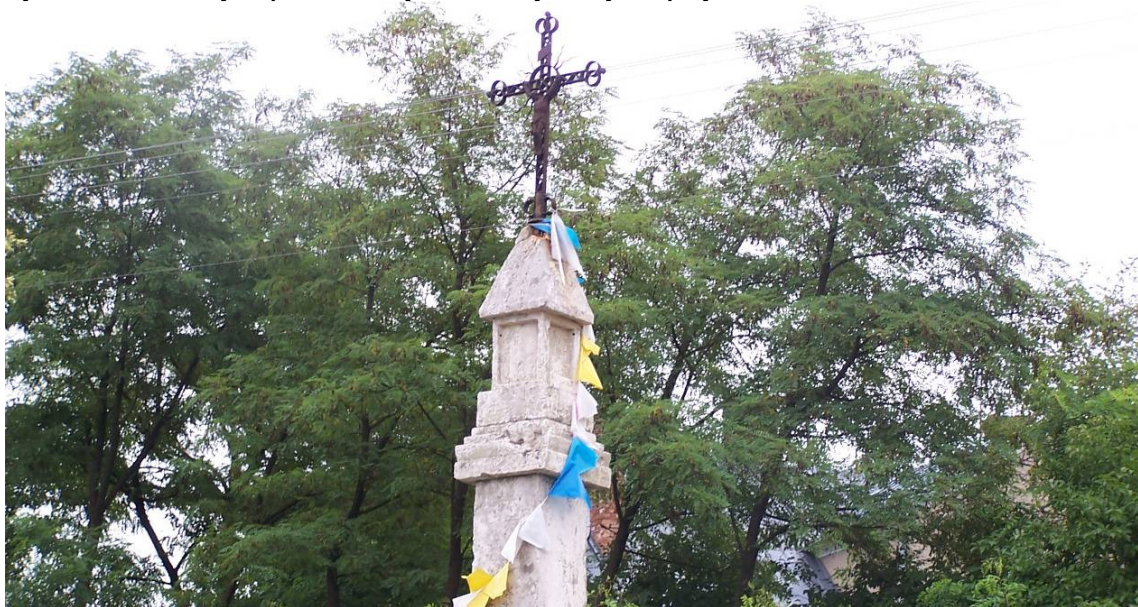
Rysunek 8 Kamienny słup zwieńczony metalowym krzyżem przy kościele