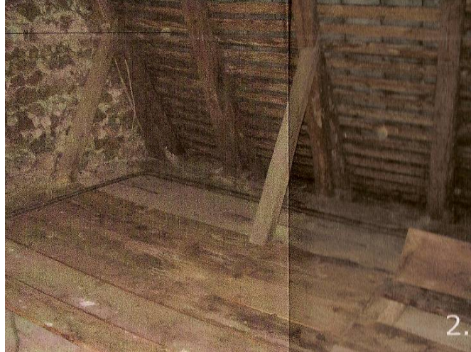
Rysunek 13 Fragmenty istniejącej więźby dachowej, widoczne uszkodzenia i zagrzybienia

zagrzybienia wynika głównie z zawilgocenia elementów poprzez nieszczelne pokrycie dachowe.