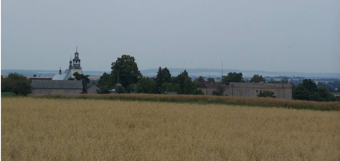
Rysunek 2 Panorama Kidowa (widok na kościół, remizę strażacką i pola uprawne)