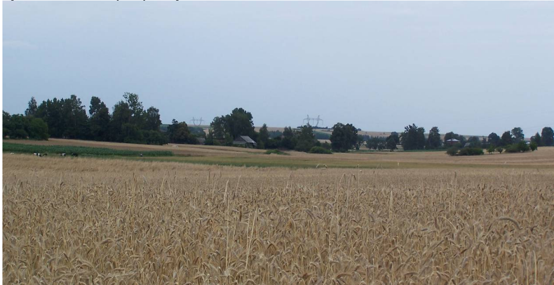
Rysunek 5 Panorama pól uprawnych w Kidowie