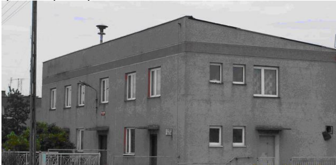
Rysunek 12 Budynek remizy OSP w Kidowie

Źródło: Grupa Doradcza Altima sp. z o.o.