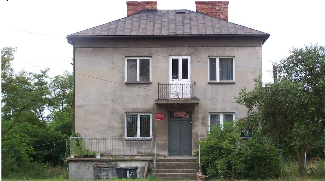
Rysunek 10 Filia biblioteki w Kidowie