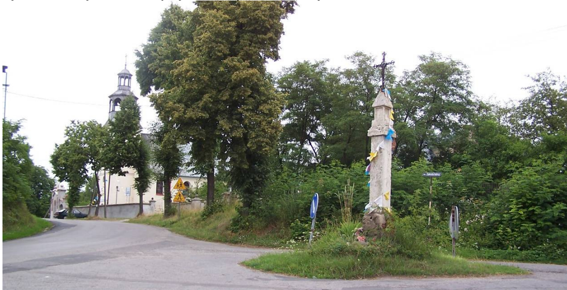
Rysunek 4 Skrzyżowanie ulic przy Kościele p.w. św. Mikołaja w Kidowie