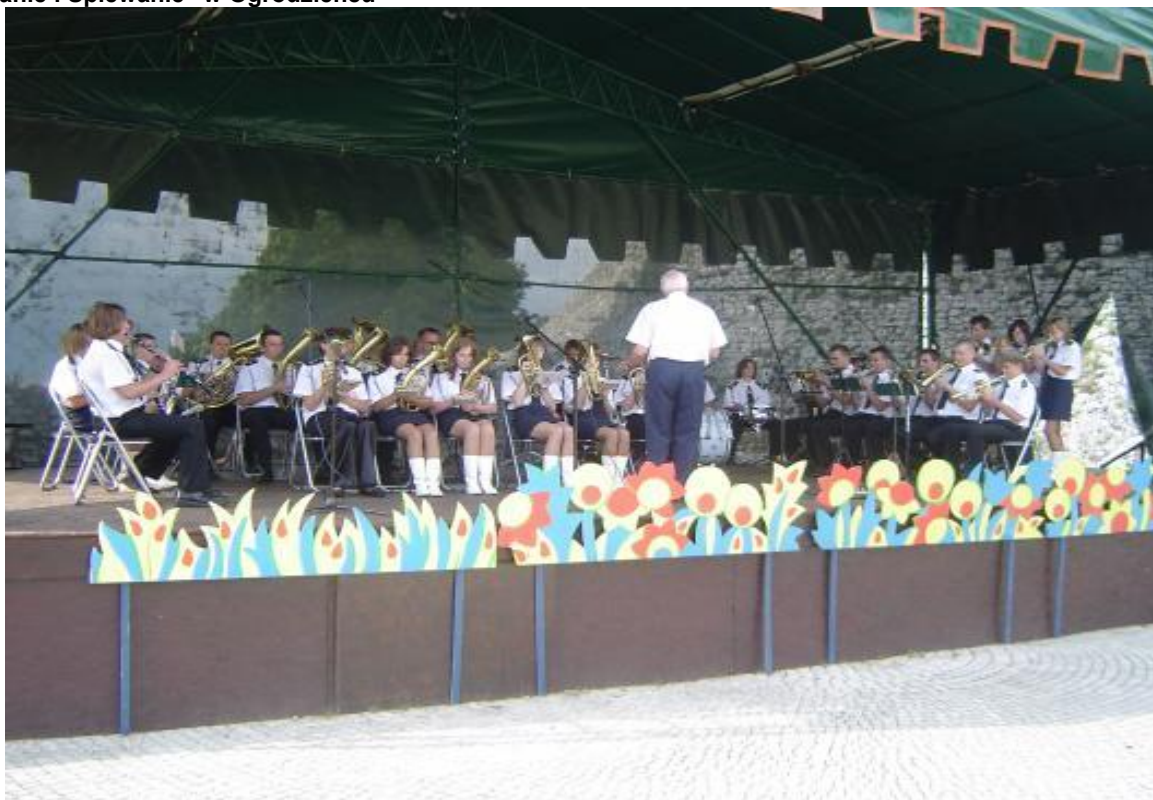
Rysunek 5 Występ Młodzieżowej Orkiestry Dętej OSP Dzwono-Sierbowice podczas imprezy „Jurajskie Granie i Śpiewanie” w Ogrodzieńcu