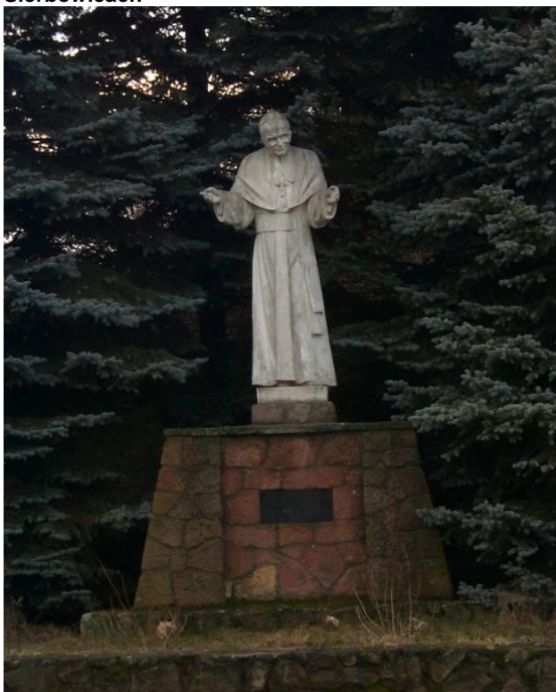
Rysunek 2 Pomnik papieża Jana Pawła II oraz kapliczka – elementy zespołu kościelnego w Dzwono-Sierbowicach