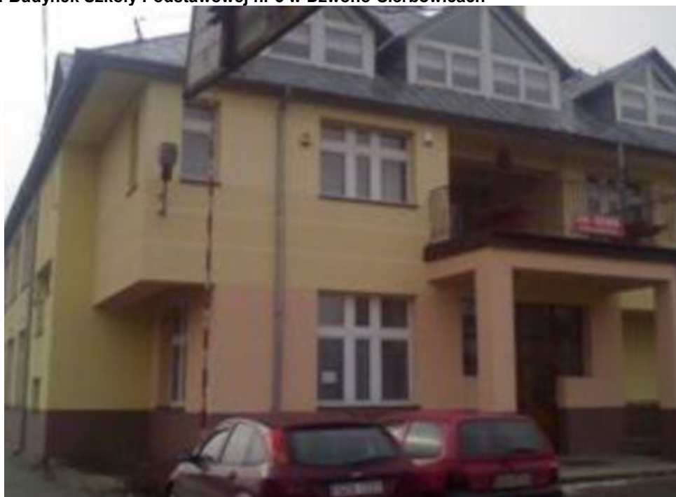
Rysunek 4 Budynek Szkoły Podstawowej nr 3 w Dzwono-Sierbowicach