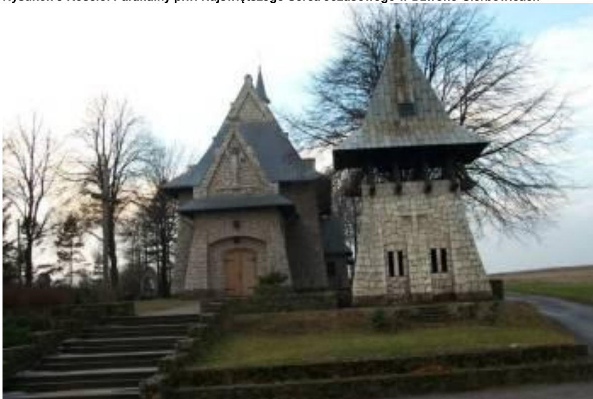
Rysunek 3 Kościół Parafialny p.w. Najświętszego Serca Jezusowego w Dzwono-Sierbowicach