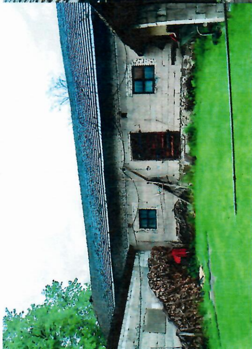
Widok budynku od południa

fotografia z opisem wskazującym orientację w stosunku do sąsiednich terenów lub stron świata albo mapa z zaznaczonym stanowiskiem archeologicznym