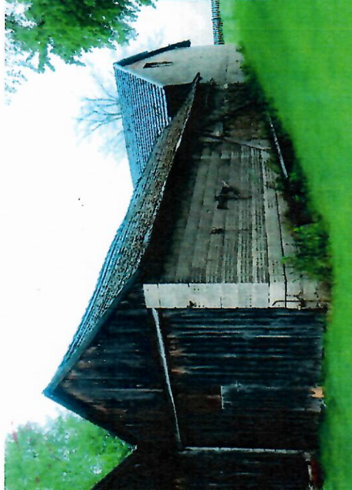
Widok budynku od południowo-wschodu