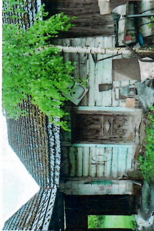
Widok budynku od północy