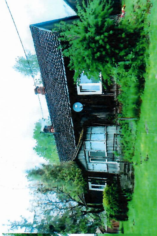
Widok budynku od południa